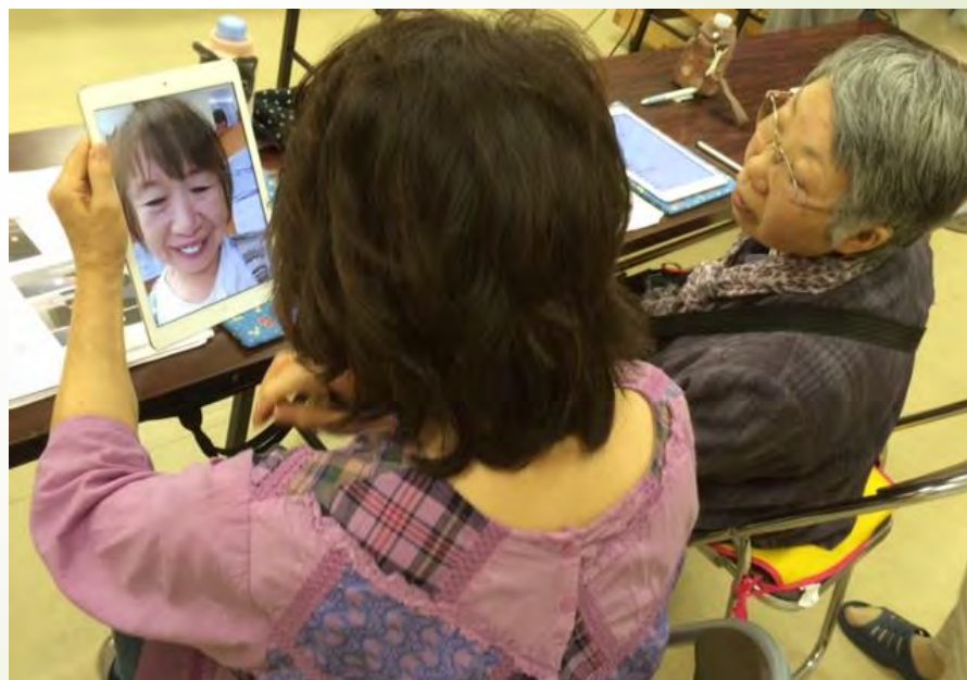
お友達とテレビ電話