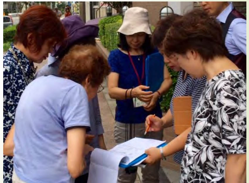
認知症予防に有効なウォーキングの打合せ中